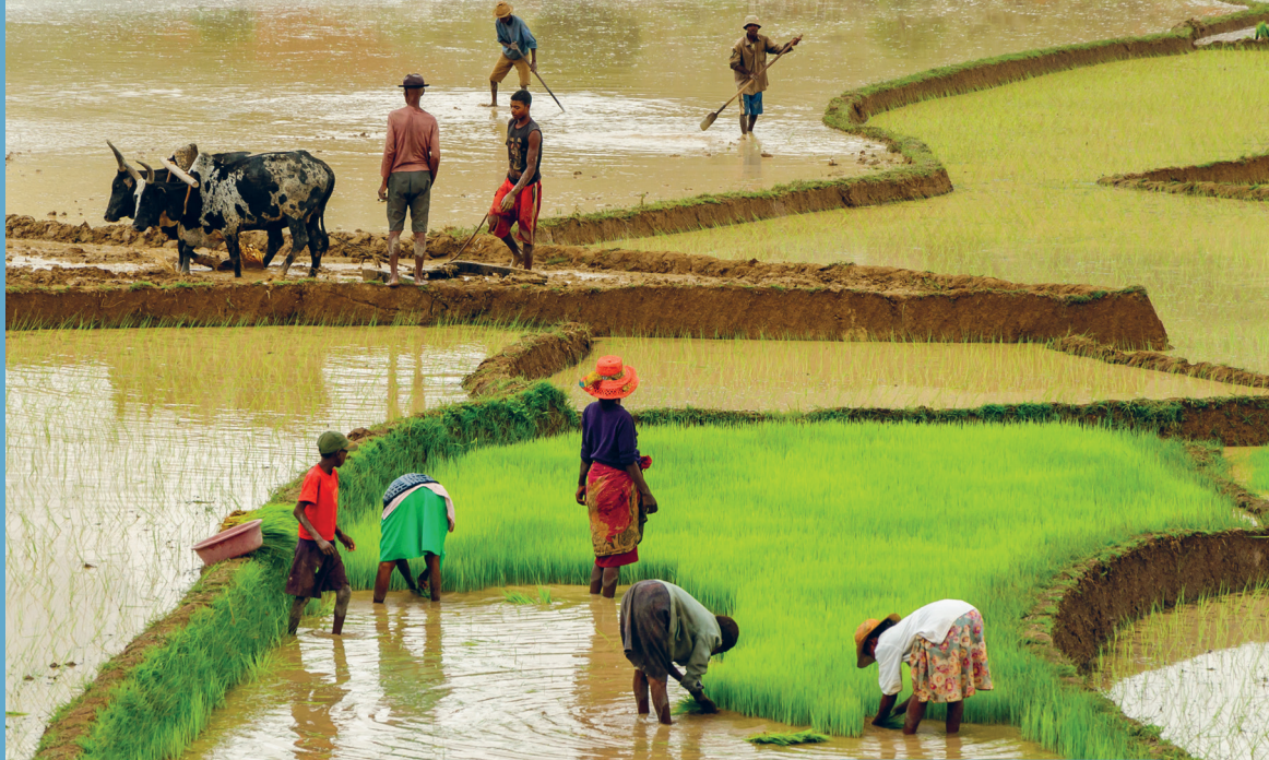
Des riziculteurs travaillant dans des rizières en terrasses

actrices du changement social, leur participation à la sphère politique a permis de mieux tenir compte des besoins des citoyens dans les initiatives d'atténuation du changement climatique et d'adaptation à ses effets. De façon plus localisée, l'inclusion des femmes dans les processus de décision a amélioré les résultats des projets et politiques liés aux climats. De fait, les politiques et projets mis en œuvre sans participation significative des femmes risquent d'être moins efficaces et de creuser les inégalités existantes.