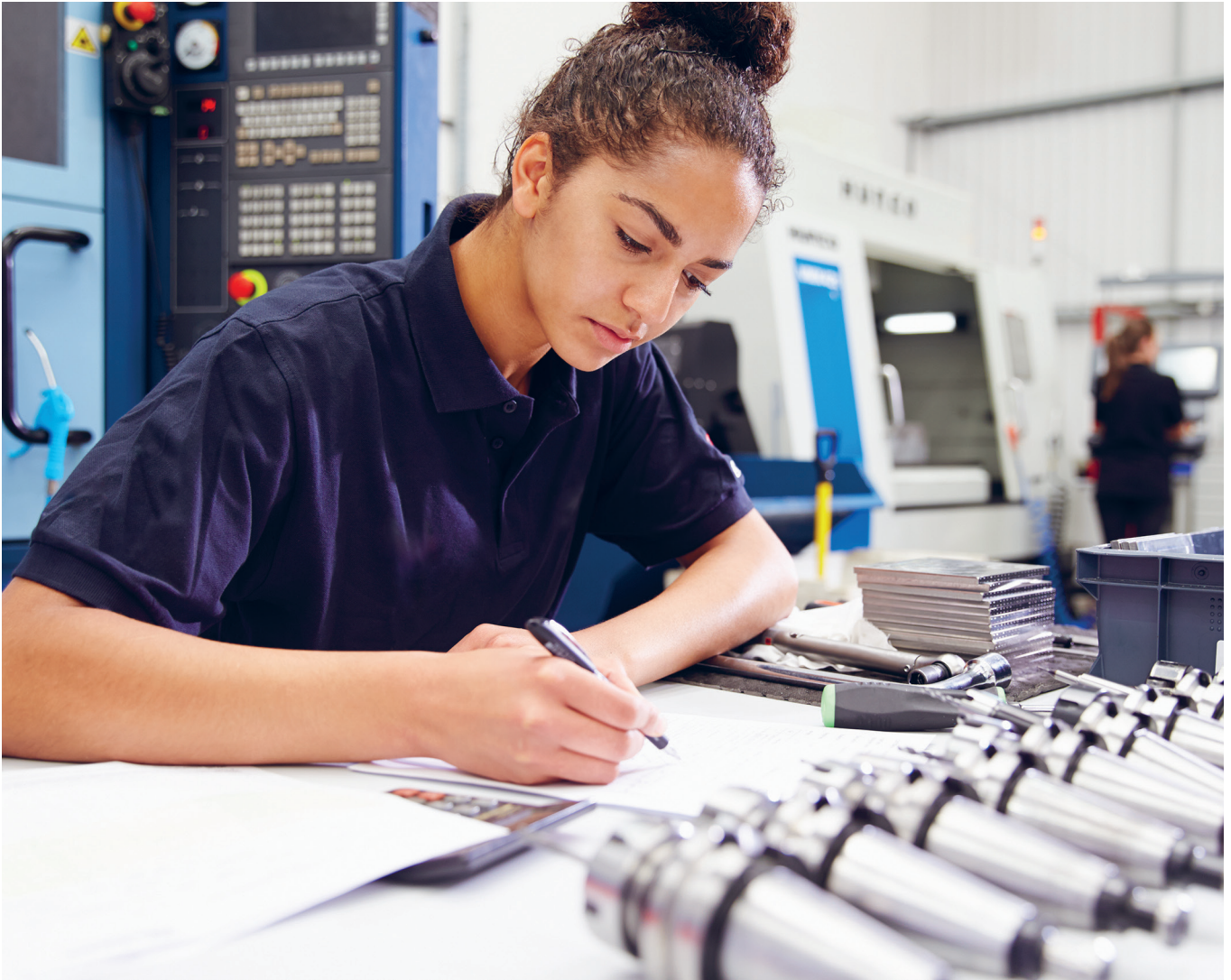
Ingénieure planifiant un projet.

La quatrième étape comprend deux aspects majeurs pour lesquels il est nécessaire de tenir compte des questions de genre :