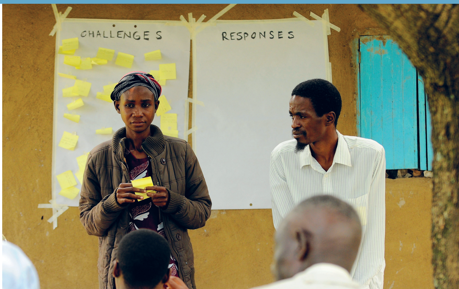
Atelier dans le village d'Othide.

Ce guide fournit des conseils pratiques afin de lutter contre les inégalités systémiques de genre, potentielles ou avérées, qui sont spécifiques au processus de l'EBT et à ses objectifs d'atténuation du changement climatique et d'adaptation à ses effets. Il propose une méthode détaillée que les équipes de l'EBT peuvent suivre pour intégrer les questions de genre à leurs évaluations.